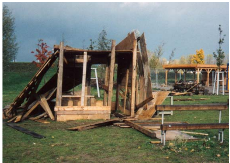
Zerstörte Hütten (2003); ähnliche Vorfälle gab es auch 2004.

Ein zweiter Problembereich ist, dass immer wieder einmal über Nacht Hütten zerstört werden. Da die übrige Infrastruktur des Platzes dabei bislang nicht angetastet wurde, liegt es nahe, dass da Jugendliche ihren Streit austragen. Für die Betroffenen sind dies deprimierende Erfahrungen. Wirksame Gegenmittel haben wir bislang nicht gefunden; Alarmanlage oder Wachschutz sind nicht finanzierbar und strenggenommen auch nicht die Mittel, die wir uns auf einer Freizeiteinrichtung für Kinder wünschen.